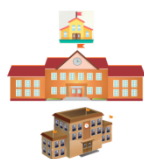
Общая характеристика муниципальной системы образования